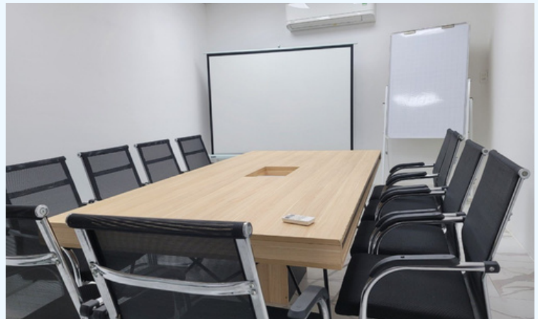
KHU VỰC PHÒNG HỌP